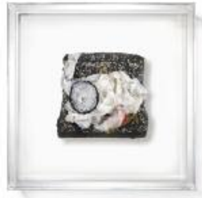
Nº de pedido: 40694