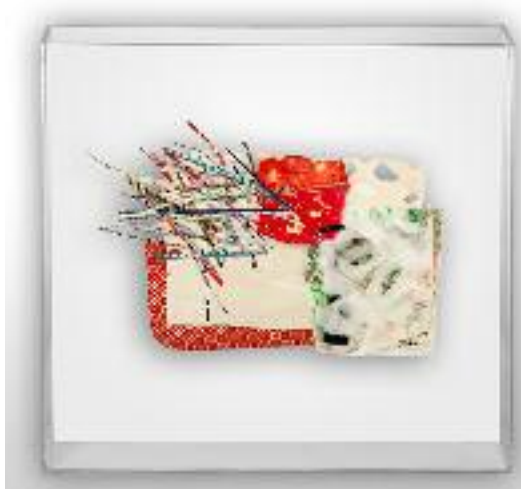
Nº de pedido: 40855

Ver más obras de la serie en www.circulodelarte.com