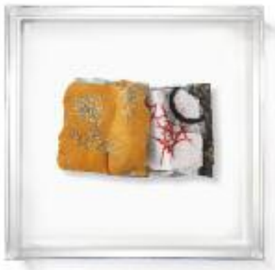
Nº de pedido: 40688