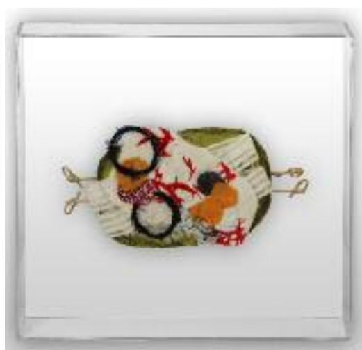
Nº de pedido: 40853