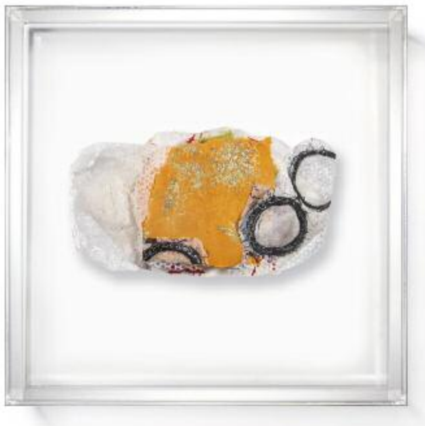
Serie Señal del Viento, 2013-2014 Collages en diferentes papeles artesanales. Enmarcados en cajas de metacrilato Formato: 29 x 30 cm Cada pieza es un ejemplar único Precio con IVA por ejemplar: Básico: 490,00 € Cuota A: 465,50 € Cuota B: 441,00 € Cuota C: 392,00 € Precio P&D: 290,00 € + 150 puntos