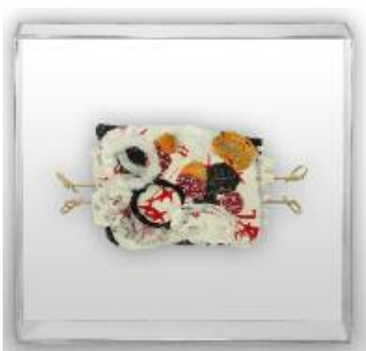
Nº de pedido: 40852