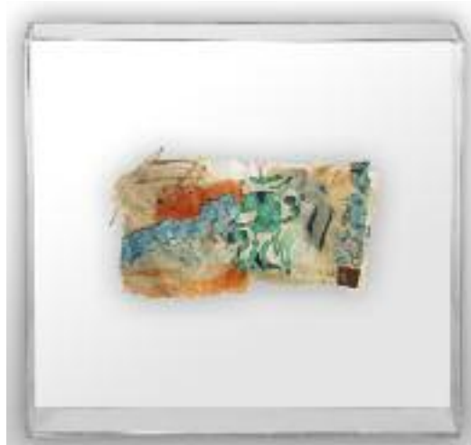
Nº de pedido: 40851