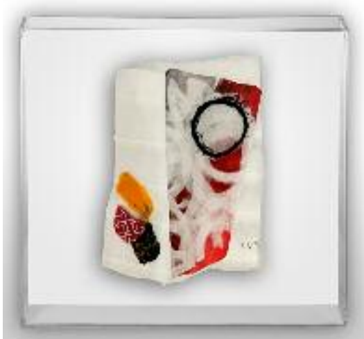
Nº de pedido: 40854