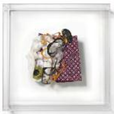
Nº de pedido: 40846