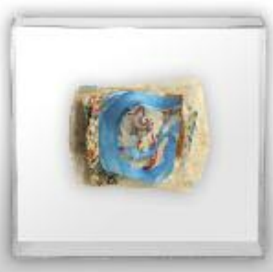
Nº de pedido: 40848