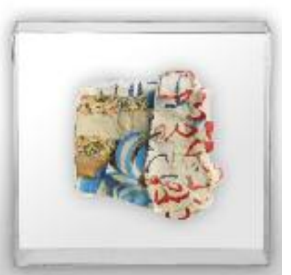
Nº de pedido: 40849