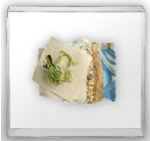
Nº de pedido: 40850