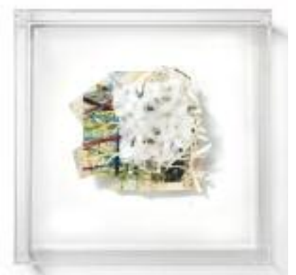
Nº de pedido: 40845